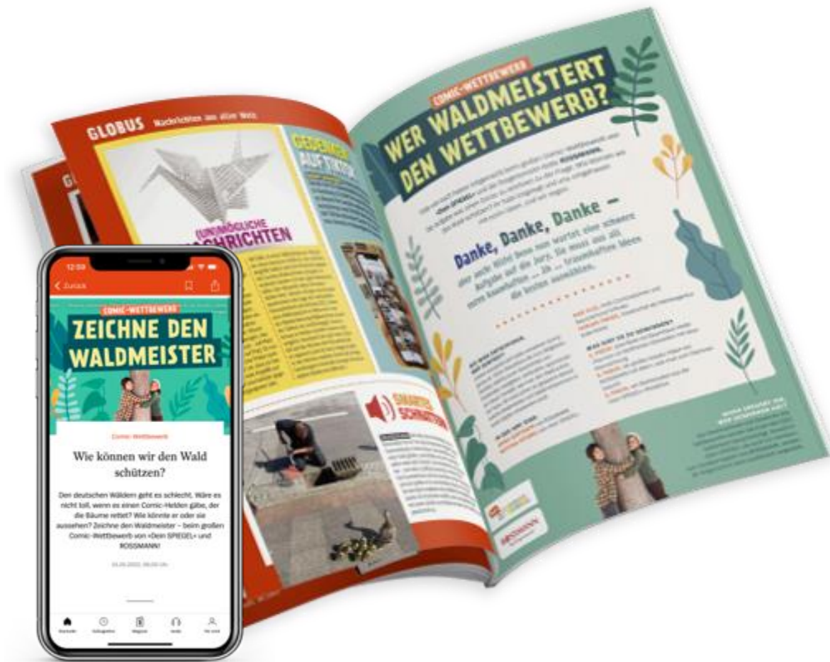
Aktueller Wettbewerb 2022

Mit dem Kunden Rossmann haben wir bereits den vierten Wettbewerb umgesetzt und gehen 2023 in das fünfte Jahr.